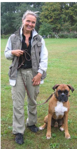
Twinbox Albus Dumbledoor Anna Penco 2,485 POÄNG