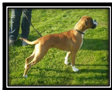
2. Incirias Honey-Honey Ägare: Pernilla Swartling Antal utställningar: 3 Poäng: 44, 5 poäng