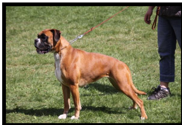
2. Korad Engelaiz Okkra Ägare: Eva Jacobson Poäng: 42,5 poäng