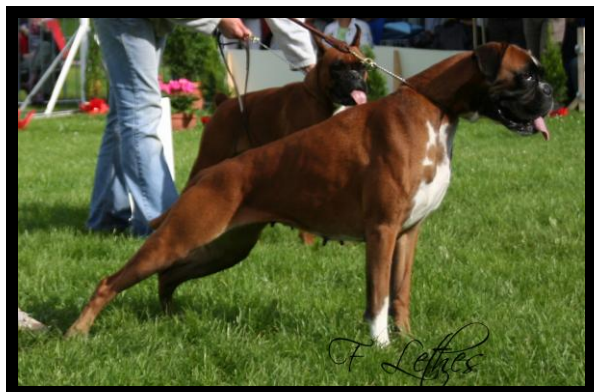
1. NORD UCH PL CH PL V-10 Korad Bippa Con Tilia Ägare: Nina Persson Poäng: 138,5 poäng